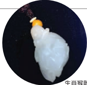
生肖猴雕件

此外,以后游客来此,还可以住宿。东入口以及山下会布置一些酒店、民宿等。胡传宏还透露,牛首山的南唐二陵景点也将扩容,规划建南唐博物馆。