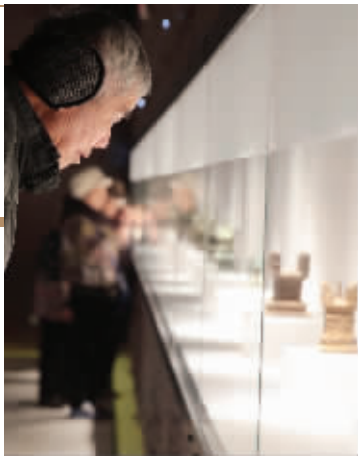
市规划局邀请市民参观大报恩寺

去年,南京市规划部门对中华门外长干桥片区修建性规划设计,曾进行过批前公示。规划以应天大街及纬七路高架以北、中华门明城墙及秦淮河以南(西街、窑湾街新建小区不在规划内),雨花路以西、赛虹桥高架及凤台南路以东为范围。根据规划,该地块内将打造越城遗址公园和文化地景公园。此外,还要打造商业文化街区。