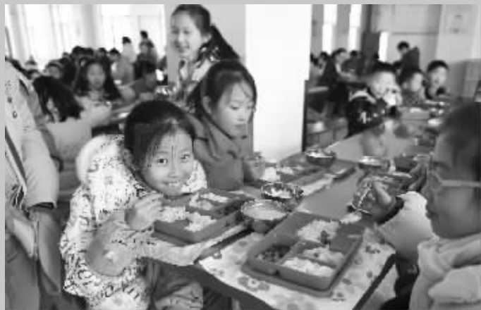
新城小学的孩子们在食堂吃午饭