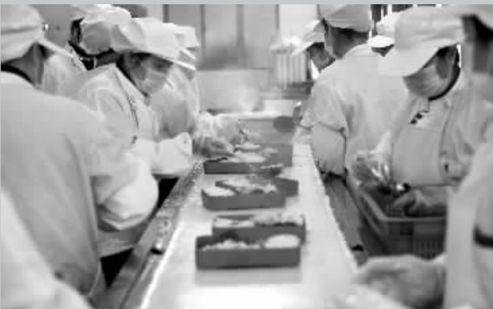
食堂工作人员将饭菜分装到餐盒里