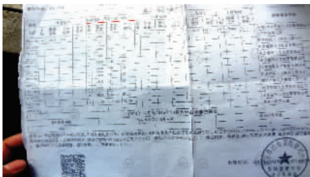
从社保中心调出来的账户情况,显示从去年11月份起,除了医保外其他账户都是空的