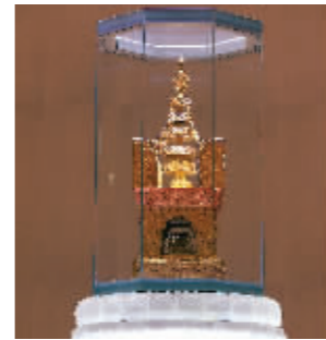
地宫中供奉的舍利