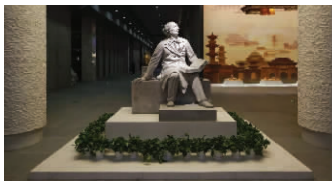
遗址公园内的安徒生雕像

遗址公园内，可以看到多处浮雕，马娘和碾磲、徐皇后礼佛，还有铜雕杨仁山等等，这些浮雕、雕塑等，再现了大报恩寺遗址公园的前世今生。在遗址公园内，记者还发现了一尊外国人像，他头发卷卷的，手中握着一本书。他是谁？现场，讲解员介绍说，这是“童话大王”安徒生。为什么要把安徒生的雕像放在大报恩寺遗址公园内呢？原来，安徒生在他的作品中曾提及当时世界知名的“大报恩寺琉璃塔”。 当年，大报恩寺琉璃塔之所以在欧洲家喻户晓，得益于文学作品等的宣传。1839年安徒生就在《天国花园》中写道：“我（东风）刚从中国来——我在瓷塔周围跳了一阵舞，把所有的钟都弄得叮叮当当地响起来！”出生于丹麦贫苦鞋匠家庭的安徒生，早年并未受过正规教育，一生也并未到过中国，他关于中国瓷塔的印象可以说明，瓷塔作为具有代表性的中国景物，在安徒生生活时代的欧洲是广为流传的，而这里的瓷塔就是大报恩寺琉璃塔。