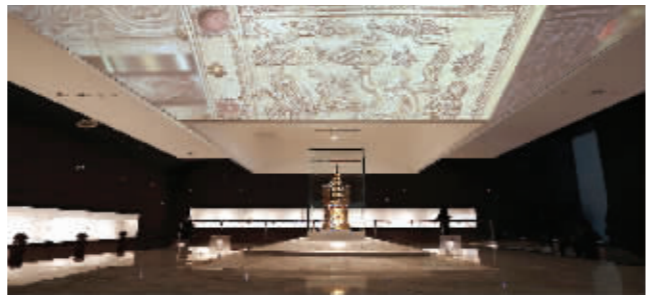
“感应舍利”被供奉在按1:1复制的阿育王塔的塔身中