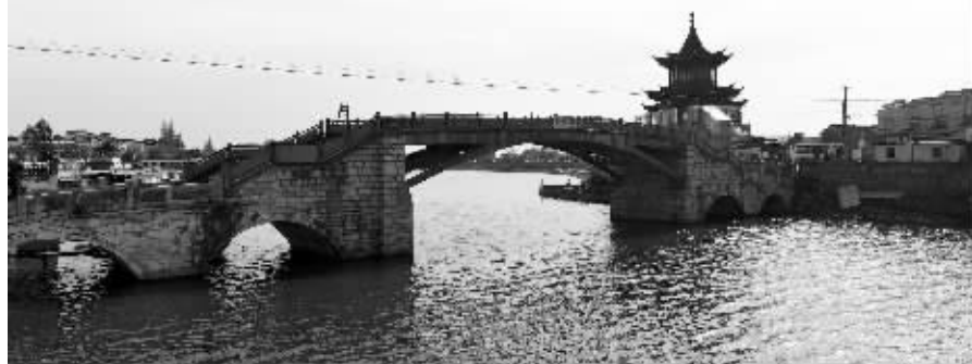
远望去,襟湖桥十分古朴,风景秀丽