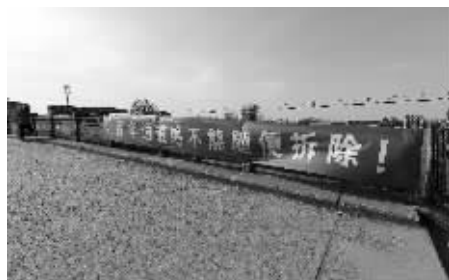
为了守护这座桥,村民在桥上搭建帐篷并挂出标语