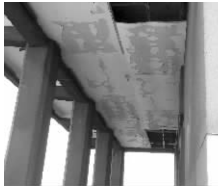
北桥头堡过道上的吊顶掉漆严重