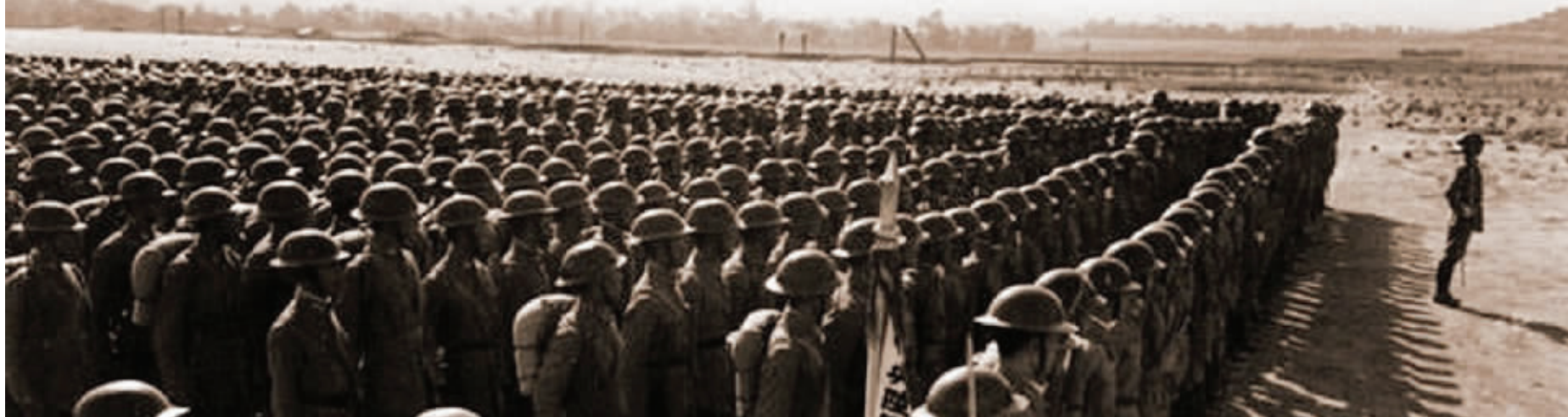
抗战中的“黄埔军校”学员