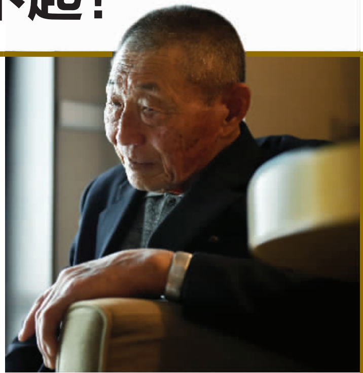
西山诚一