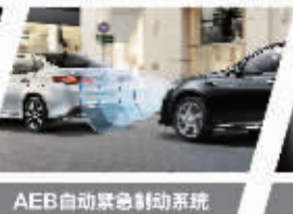
AEB自动紧急制动系统