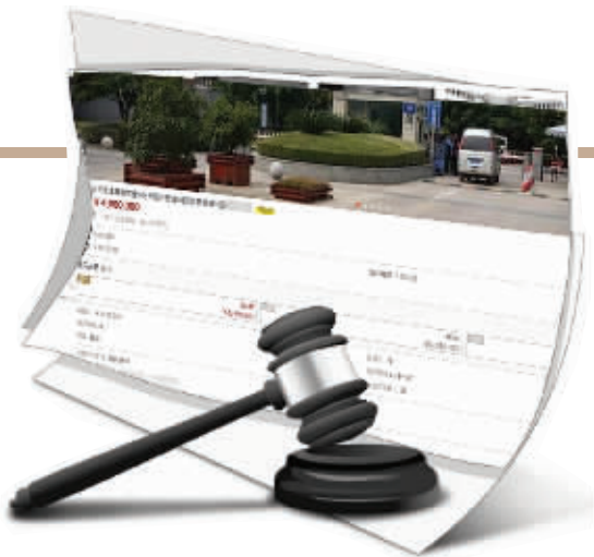
奥体新城清竹园的一套房子拍了406万元

楼市持续火爆下,汹涌的购买力正冲向每一个可能存在的“洼地”,淘宝拍卖房产也因此备受关注。近日,南京河西一套房子拍卖,足足经过81轮竞价才分出胜负,成交价比起拍价高出96万元。不过业内人士提醒,对网上拍卖的房产要多留个心眼,避免一些纠纷。