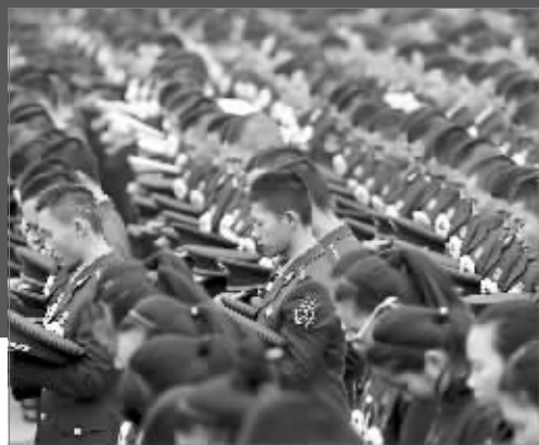
国家公祭仪式现场，全场默哀

12月13日，南京，阴。位于南京城西的侵华日军南京大屠杀遇难同胞纪念馆内国旗半降、庄严肃穆。上午10时，南京大屠杀死难者国家公祭仪式在这里举行，现场一万余名社会各界人士齐声高唱国歌。10时01分，凄厉的防空警报划破天际。全场默哀，深切缅怀南京大屠杀的无辜死难者，缅怀所有惨遭日本侵略者杀戮的死难同胞，缅怀为中国人民抗日战争胜利献出生命的革命先烈和民族英雄……纪念抗战胜利70周年的特殊年份里，举国上下同悼南京大屠杀死难者，用胜利告慰逝者，同时再次警醒国人，民族伤痛决不能重演。