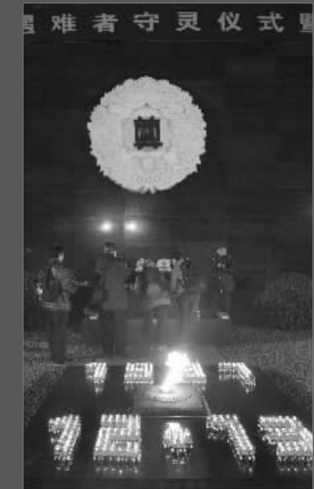
各界人士参加烛光祭