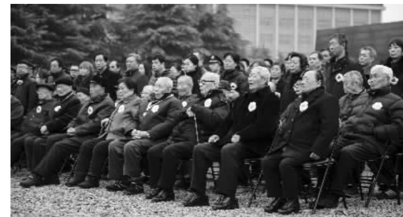
17名南京大屠杀幸存者代表被安排在阵列最前方就座

他告诉现代快报记者，去年首个国家公祭仪式结束后，习近平总书记接见了他们。“总书记的谈话让我印象深刻，他说，我们回忆这段历史，不是报仇，是要让更多人承认这段历史、反省这段历史，走和