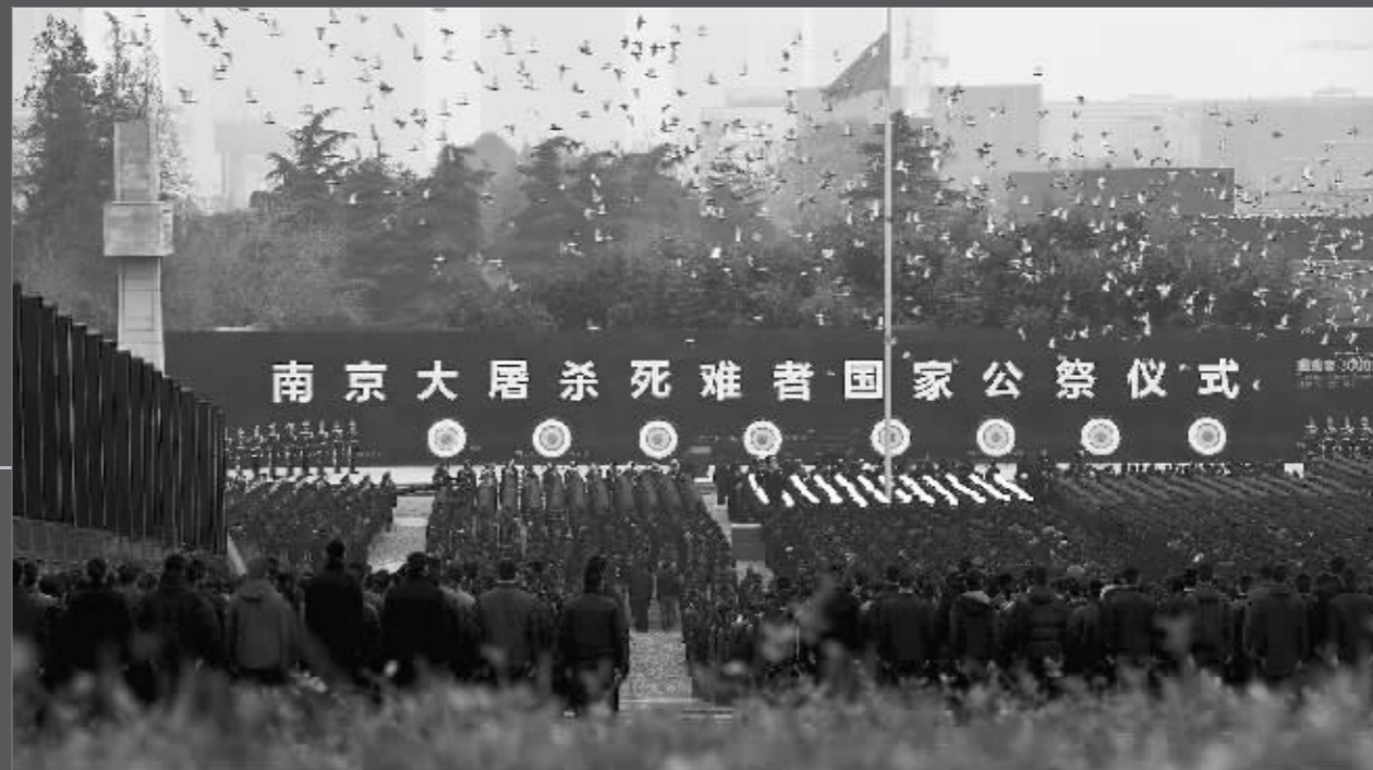
国家公祭仪式上放飞和平鸽