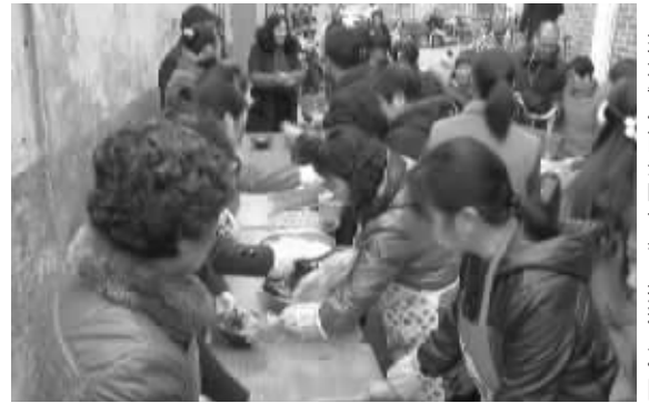
现场制作面条的长桌

快报讯(记者 孙玉春)一些商家为了推销商品,为了吸引人气常常花样百出。昨天上午,南京六合一家保健器材商家为了推销产品,在办公楼下面一条窄窄的巷子里,请来10多个厨师摆开宴席,免费制作供应韩国料理面条。