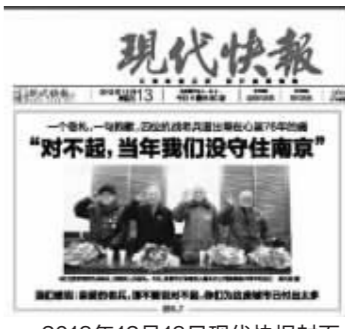
2013年12月13日现代快报封面