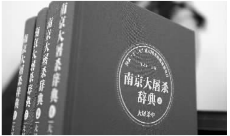
《南京大屠杀辞典》首发,南京大屠杀幸存者岑洪桂获赠新书

“《南京大屠杀辞典》每个词条的开头都有定性语言,不用或少用‘最’、‘唯一’等绝对性词语,词条中涉及部队番号的,统一用汉字等撰写原则。”中国抗日战争史学会副会长、侵华日军南京大屠杀史研究会会长、《南京大屠杀辞典》主编朱成山介绍说,辞典编撰工作自2010年12月13日启动以来,由60多位海内外专家历时5年编纂,昨天终于全部出版面世。