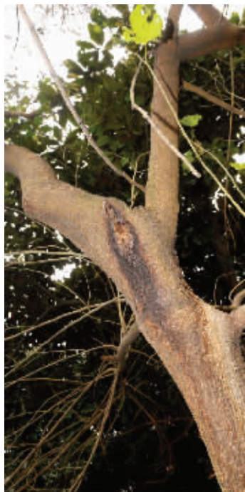
被美国白蛾侵袭的桑树

园林专家猜测,美国白蛾会出现在南京,估计也和天气转暖有关。还有专家猜测,可能和新物种引进有关。“一些苗木引进时会夹裹虫卵和害虫,到了南京,气候条件适宜,它们的繁殖能力特别快。”这名专家说,美国白蛾的成虫夜晚交配后,一次性产卵可达千粒,15天就孵化出来了。