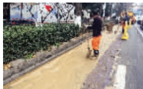
工作人员清理路面泥浆

昨天上午9点多,南京鼓楼区北京西路一处路面,突然冒出一片泥浆。现代快报记者了解到,这是地铁4号线进行盾构施工,施工所用的泡沫剂混着泥沙和地下水,受到压力影响后冒出来。