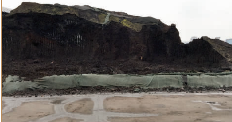
工厂内堆积的废料,上面覆盖了防尘网