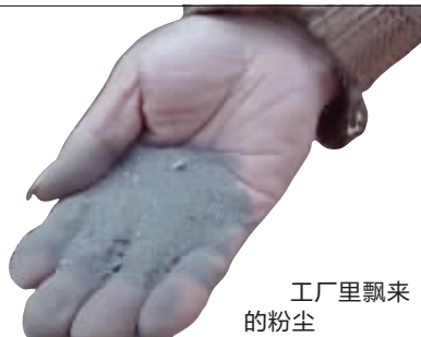
工厂里飘来的粉尘

“回收的这些灰尘本身就很干、稀,容易飘散,前期运输中用的是自卸车,没有防尘网,确实有污染。现在是用槽罐车进行运输,并从露天转入室内卸灰,同时进行覆盖、洒水、保洁等防护措施,