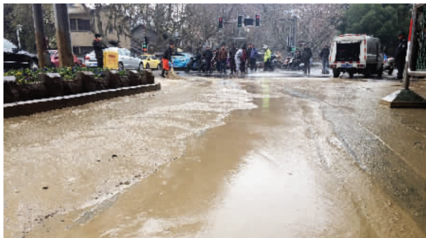
北京西路冒泥浆