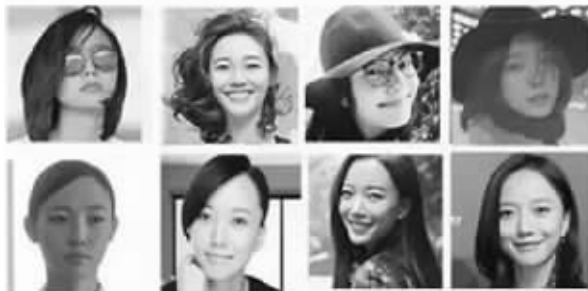
网友PS恶搞的验证码