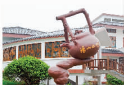
用再去上海、香港了!

线路详情:汤山七坊、汤家家温泉村、奥特莱斯一日游 发班日期:12月19日、12月26日 发班价格:15元/人(70周岁以上,18周岁以下加收20元/人,包含景点大门票,往返空调大巴,全程导游)