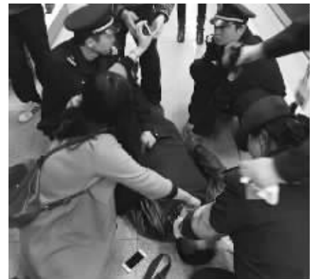
大家热心救助昏倒的男子

在行驶的地铁上,如果有乘客突发疾病应该怎么办呢?今年5月份,地铁2号线上一名1岁左右的男童因发高烧突发惊厥。情急之下,有热心乘客启动“紧急解锁”装置,列车还未完全进站就停了下来。原本想第一时间帮助男童,却没想到因此列车延误了两分钟。不过,前天晚上在地铁3号线上发生的一起突发事件,车厢内热心乘客的处理就很恰当。这名乘客第一时间按下“紧急呼叫”按钮联系上了司机,并通知了地铁工作人员和警察,在大家的帮助下,晕倒的乘客被及时送往医院救治。