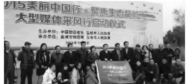
活动启动仪式现场

“东台西溪这次又火了!”12月1日,“2015美丽中国行·聚焦生态盐城”大型媒体采风启动仪式,在东台西溪景区的董永七仙女文化园举行,中央媒体20多位记者聚焦东台西溪。在现场,数百位游客和市民观看了仪式和精彩的文艺演出,感受了深厚而别样的西溪文化。