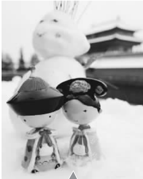
蔷薇淼淼:北京大雪,四爷与若曦出宫游玩~ 不重名好不好JIAO杨:昨天在故宫看见一个趴在雪地里照小人儿的,敢情照的是四爷和若曦呀! (@蔷薇淼淼 微博)