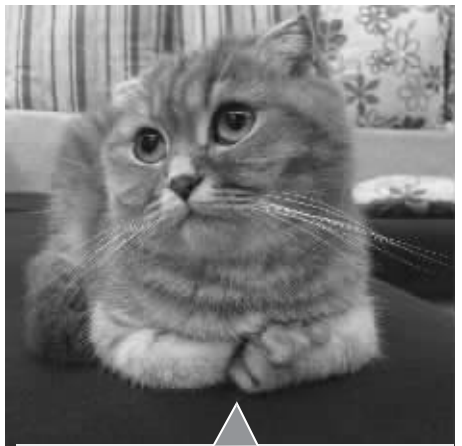
回忆专用小马甲:一直想揍端午!最近的一次原因是它把我一根鞋带藏起来了,我看着她叼走的,当时没在意,现在我找两天了,没见,问也不说! 网速虐我千百遍:你可以把另一根给它,看它藏哪? (@回忆专用小马甲 微博)