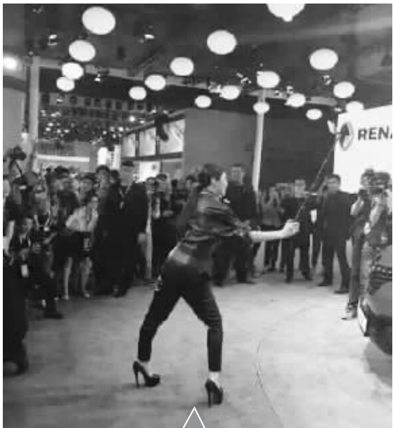
飞飞是大王:朋友圈看见的,哈哈哈哈哈! 江南大野花:自拍一分钟,镜下十年功。