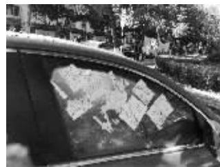
小车被贴了20张违停单

贴了这么多违停单,为什么不告知车主处理呢?秦淮区夫子庙街道城管执法大队负责停车管理的工作人员表示,街道城管部门只负责巡查贴单子,具体处理得由交