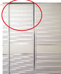
许先生加的衣柜门无法完全闭合