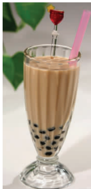
冬天来了,很多女生爱喝热奶茶 资料图片

其次,便秘也会引起心脏疾病。中医认为,肺与大肠相表里,就是肺气和大肠是相互关联的。如果大便干燥,人就会憋住气使劲去排便。如果肺心之气很虚,在排便的一刻,上面就会立即空掉,就会促使心脏病发作。所以,一旦感到便秘,也不要使太大的力气,以免引发心脏病。