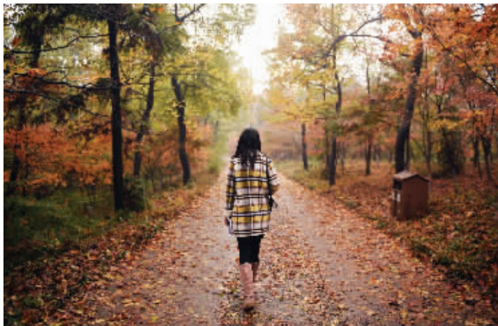
栖霞山红叶进入最佳观赏期