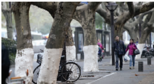
行道树过冬,不但要保暖还要“理发”

昨天,南京市绿化园林局的工作人员告诉记者,他们从2013年冬天起,开始利用探地雷达等先进技术给主要干道的行道树“体检”。根据“能补尽补、能补快补”的原则,去年,南京补植行道树1608株,完成6000多株行道树修剪。“今年冬天,将继续给部分行道树修剪‘发型’。”他说,修剪工作将持续到12月底。