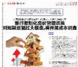
昨天快报相关报道