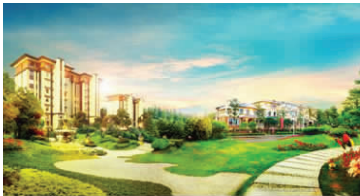
南京碧桂园效果图