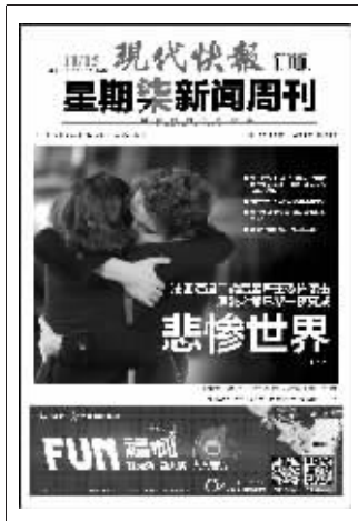
(上期星期柒新闻周刊封面)