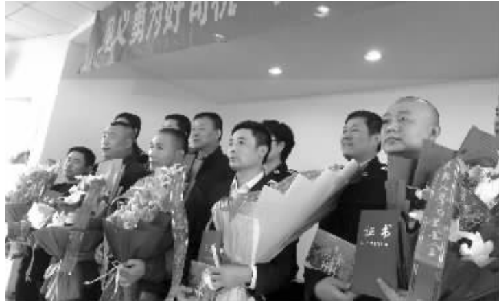
5名见义勇为的出租车司机被表彰