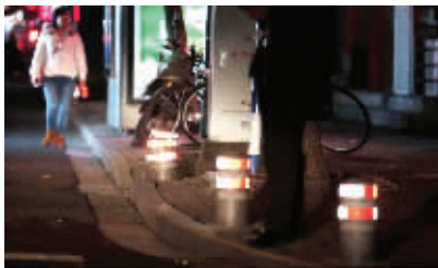
会发光的隔离桩

快报讯(见习记者 杨菲菲 记者 赵丹丹)隔离桩的颜色和人行道地砖很接近,晚上出行看不出来怎么办?别担心。昨天,南京市城管局发布公告,建邺区1630个隔离桩穿上了“反光衣”,大晚上也会发光,市民不用担心看不清了。