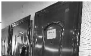
▶ 抽检不合格的防盗门

家中失窃,不少与防盗门质量有关。就在昨天,江苏省质监局发布2015年防盗门抽检报告。这次共抽查50批次样品,其中合格39批次,不合格11批次,合格率为78%,也就是说两成多不合格。令人惊讶的是,抽检发现,竟有不少厂家在锁具处用纤维板代替防护钢板,而这恰恰是盗窃破坏时的主要部位,极大增加了被盗的风险。