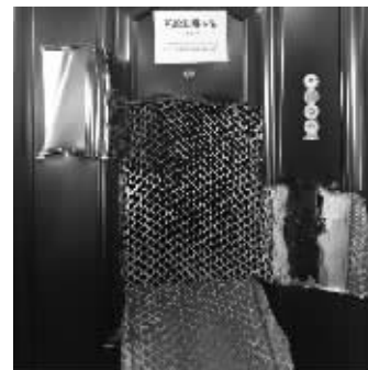
这个防盗门的填充材料是蜂窝纸

不少人觉得,防盗门里面肯定填充了金属材料,不过真相可不一定如此。这次对50批次样品进行的风险监测显示,有49批防盗门是用蜂窝纸作为门扇填充物。关于防盗门的填充物,目前并无明确规定。甲级防盗门通常采用硅酸铝岩棉和铝箔,乙级防盗门通常采用岩棉和聚氨酯泡沫,丙级和丁级填充的都是蜂窝纸,基本上没有保温、防火性能。“这次抽检98%的防盗门填充物都是蜂窝纸,也和抽检的金属入户门中丁级门占大多数有关。”薛涛说。