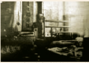
溥仪出宫时的养心殿原状