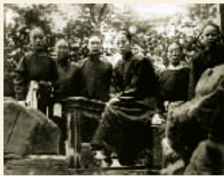
隆裕太后在紫禁城旧照

明的行不通,溥仪又暗中盘算,起了盗宝之心。他想到了一个办法,弟弟溥杰和堂弟溥佳每天都来宫里上学,每天给他们些赏赐,让他们装在包袱里面,出宫时带出去。其中有宋版的《抱朴子内篇》,宋版李涛刻《续资治通鉴长编》等书,都是传世稀有之物。为了存放宝物,溥仪还派人在天津英租界内秘密买了一幢楼房。