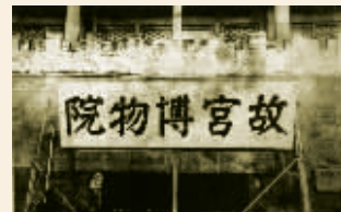
李石曾题写的“故宫博物院”匾额 本版图片摘自《故宫三部曲》