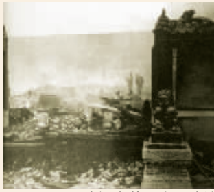
建福宫花园火后残迹