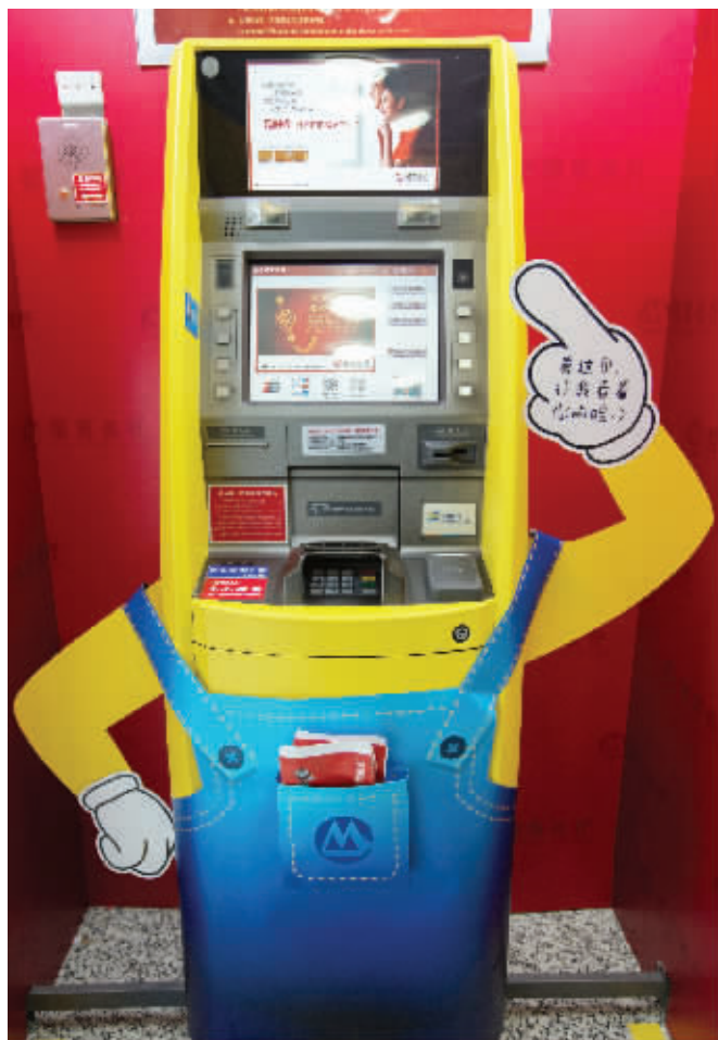
小黄人造型的“刷脸神器”感觉萌萌哒

招商银行表示,在安全性方面,“刷脸取款”拥有三层安全防护,包括人脸识别、手机号码验证、密码验证,这些将极大地提高取款的安全性。据招商银行相关工作人员介绍,刷脸取款应用“人脸识别技术”利用核心算法对人脸部的五官位置、脸型 and 角度进行计算分析,保证了较高的识别准确率。此前,招行就曾在柜面及可视柜台渠道应用人脸识别技术进行辅助核身,其人脸识别技术已经经过了反复的考验。