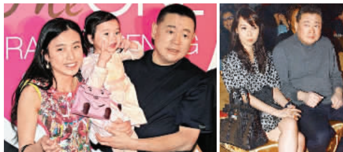
刘銮雄与女友甘比