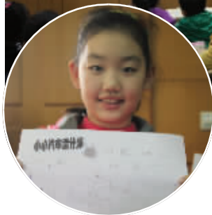
▲老师在上“小小汽车设计师”的汽车主题示范课