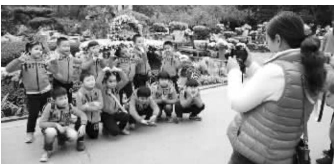
南京一所幼儿园昨天组织孩子们秋游 网络图片,请作者来领稿费

现代快报记者了解到,其实南京不少学校已经进行了秋游,也有些学校昨天仍按计划秋游。早在10月初,建邺区实验小学就组织了学生秋游。学校的负责人表示,秋游要提前向相关部门报备,出行前多次在班级上、全校活动上对学生进行安全教育,当天乘车前、乘车途中、乘车后,老师也会给学生进行安全提醒和教育,确保安全出行。昨天,还有网友晒出了南湖沿河幼儿园小朋友们秋游莫愁湖的照片,称要为幼儿园点赞。