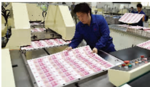
北京印钞有限公司工作人员将印制完成的大张新版百元钞票摆放在机器上进行切割

在北京西城区，武警把守的北钞公司五层高的新工房里，机器轰鸣，新版百元钞票正在这里印刷。据北京印钞有限公司印钞工艺负责人介绍，从白纸到钞票，要经过胶印、凹印、印码和检封四道严格工序，从白纸入库到钞票出厂大约要一个月时间。