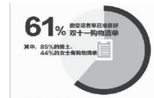
图:受访青年双十一购物清单准备情况