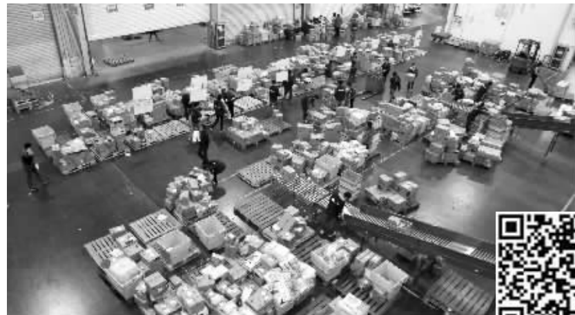
苏宁物流基地内,工人们忙着包装货物

实习生 任珈仪 见习记者 刘静妍 现代快报记者 孙玉春 赵书伶 张瑜 刘德杰 刘元媛