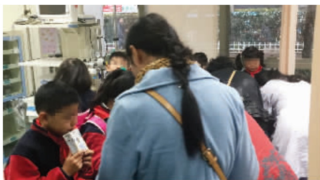
受伤的孩子在医院吃午饭