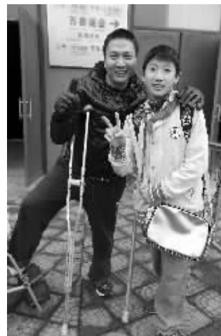
脚受伤的爸爸拄着拐杖支持儿子