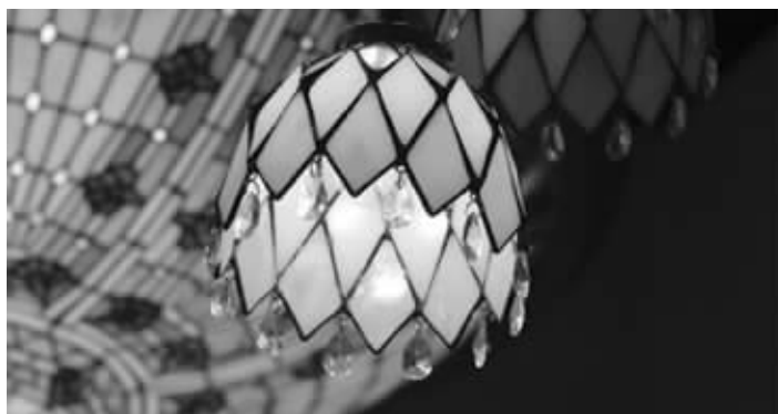
古镇的灯,不光便宜,款式也新 资料图片

“见证中山美,见证卡芬达”活动正在如火如荼地征集中,不少前来咨询的读者除了表示,希望去中山购买家具的兴趣之外,还表达了很想去古镇购买灯具。