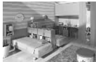
装修可以考虑中性色调 资料图片

统也是不错的选择。它能清除室内装饰后长期缓释的有害气体,排除细菌病毒,调节室内湿度。带宝宝的妈妈们也不用担心雾霾天,在家也能享受到清新的空气。