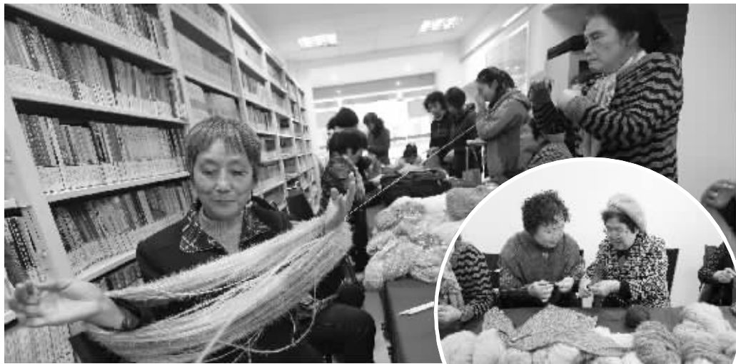
爱心妈妈要给孩子织漂亮的毛衣、围巾和手套