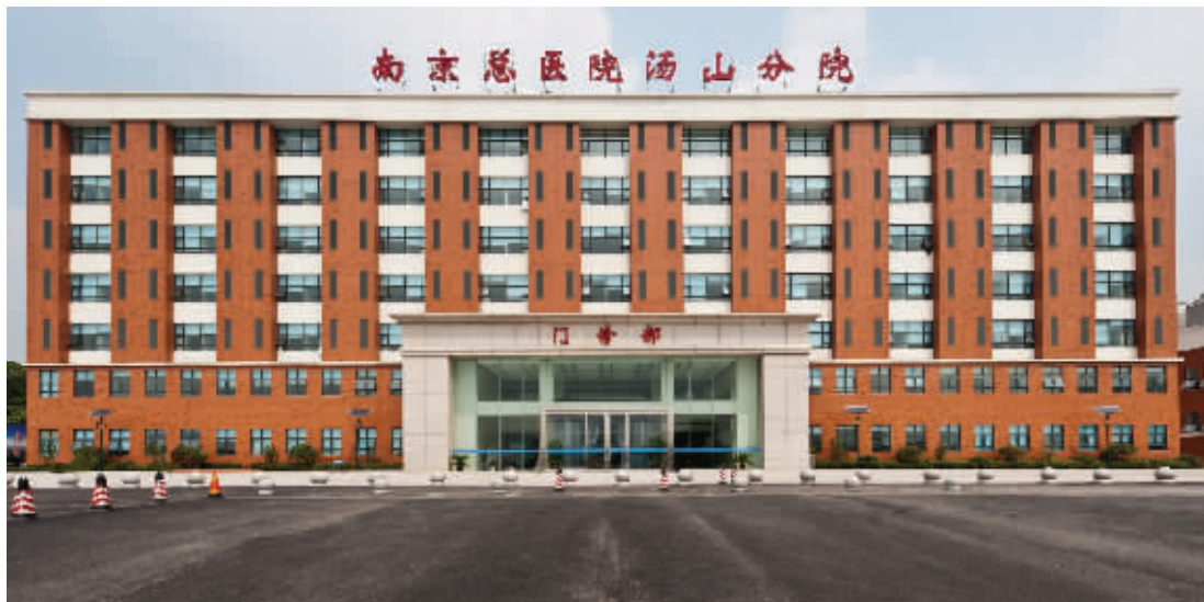
医院大楼