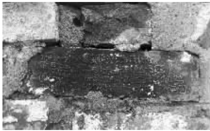
围墙中可见明城砖

据了解,这段围墙的拆迁工程属于中央北路95号地块危旧房改造项目,记者联系上拆迁小组负责人。对方表示,目前拆迁工程还没开始,居民发现城墙砖的相关情况,已经向文保部门反映,等文保部门有明确的保护方案后再动工,会和文保部门一起保护城墙砖。现代快报记者随后咨询了南京城墙保护