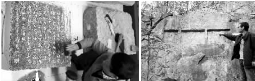
工作人员对乾隆御碑进行拓片 玲峰池镶嵌御碑的岩壁

碑的正文有100个字,“天半溧天池,玲峰四面奇。五年才一照,为尔坐移时。山以万丈计,泉淙为有源。下视沟洫盈,岂可相衡论。老松高百尺,新松低数寸。小草莫相欺,会有凌云分。淡淡含春日,萋萋吐春烟。野花姍入影,也自一时妍。不肯泻为瀑,凜然守太初。忽怀齐隐士,亟命返肩舆。”