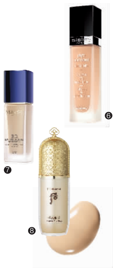
1.阿玛尼大师造型粉底乳;2.兰蔻新奇迹薄纱粉底液;3.魅可矿物质粉底液;4.YSL圣罗兰墨水粉底;5.Dior迪奥凝脂星光亮妍粉底液;6.希思黎持久粉底液;7.美素玉颜光润亲肤粉底液;8.后拱辰享美玉容粉底液;9.薇姿柔肤水;10.欧莱雅丝柔雾感粉膏棒;11.百洛护肤油;12.曼秀雷敦甜吻润唇球

持久水润的妆容一直是令人向往的妆效。一提到保湿,大多数人想到的是肌肤护理,他们认为只要护理做得好,肌肤就会持久保湿。其实保湿不仅仅是通过肌肤护理来的,选对合适的粉底也是关键!粉底液是妆容开始的第一步,在整个妆容中发挥着重大作用。想要拥有无瑕水感的裸肌妆容,跟着小编来选一款适合的粉底液吧!