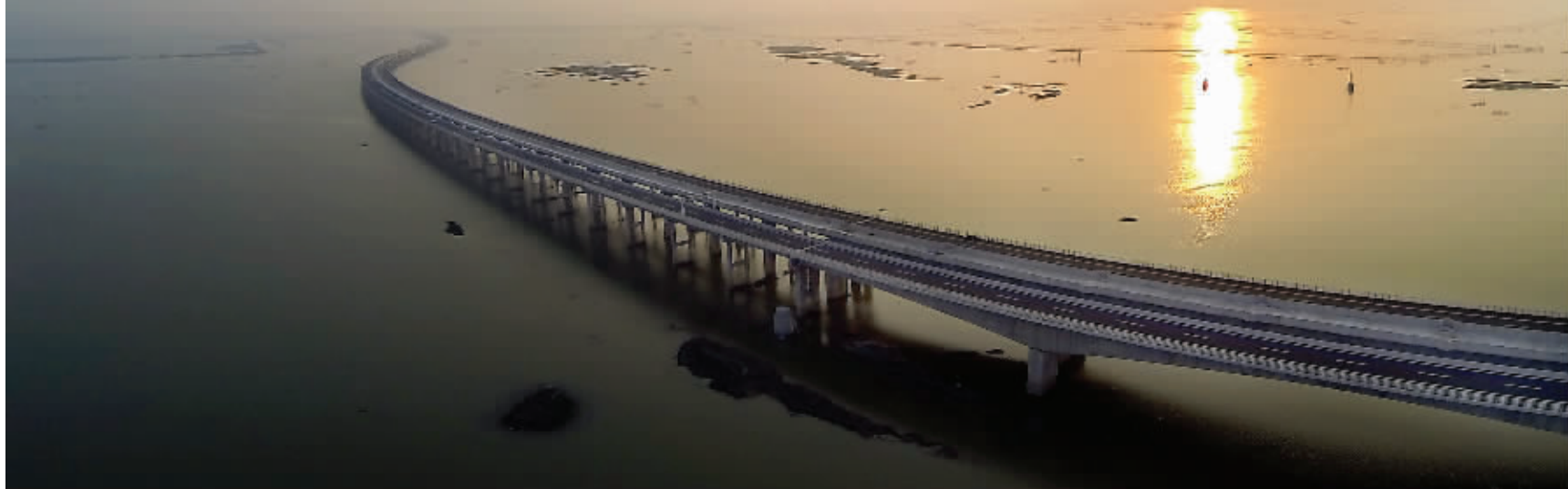
石臼湖特大桥的美景

说起美丽的山水景色,相信很多人想起的一句诗词应该是“落霞与孤鹜齐飞,秋水共长天一色”。现在,这样的景色在南京的一条公路上也可以轻松看到。10月31日,南京至高淳的新通道建成通车,新通道的建成,除了大大缩短了高淳区与南京主城的距离之外,更重要的是为南京市民开辟了一条美丽的公路,其中横穿石臼湖长达12.6公里的石臼湖特大桥,更是可以让人饱览湖光山色美景,等到冬天到来,市民们还能看到天鹅呢。