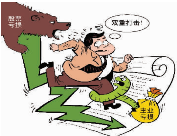
上市公司炒股很有可能得不偿失

三季度报披露已经落下帷幕,上市公司在报告期内的经营情况以及股权投资状况也随之公开。截至10月31日,两市共有256家公司在三季报中表示在报告期内进行了证券投资。据同花顺iFinD统计数据,今年前三季度,上市公司的证券投资总金额达到了3523亿元。