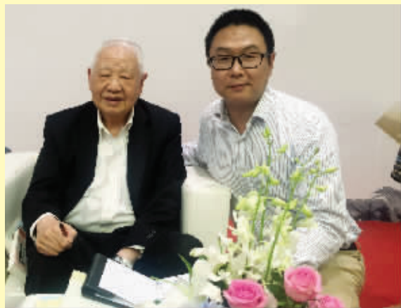
洛夫与现代快报记者合影