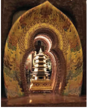
佛顶宫内景