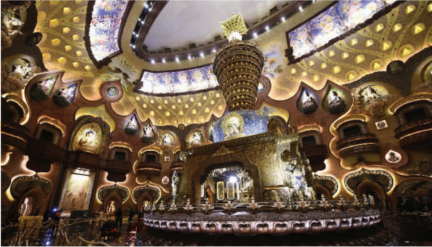
供奉佛顶骨舍利的佛顶宫千佛殿舍利塔

据介绍,六角玲珑莲花宝塔高4.4米,由塔座、塔身、塔顶三部分构成。塔座是由108朵铜铸莲花瓣组成。“佛顶骨舍利平常就供奉在这个塔身中。”专家透露,宝塔内使用密闭的玻璃宝盒供奉着佛顶骨舍利,防火防爆,下方还装有恒温恒湿系统,以保证佛顶骨舍利供奉的最佳环境。