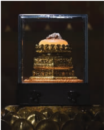
佛顶骨舍利