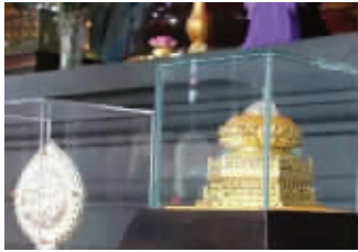
佛顶骨舍利之前供奉在栖霞寺

约2500年前,佛祖释迦牟尼涅槃,遗体火化后的舍利被信众视为圣物,争相供奉。2008年,南京古长干寺遗址地宫发现了一枚舍利,它正是象征最智慧头脑的释迦牟尼佛顶骨舍利,也是目前为止全世界发现的唯一一枚。昨天,“释迦牟尼佛顶骨舍利供奉大典”在南京牛首山隆重举行,佛顶骨舍利被迎请到这里长期供奉。牛首山遗址公园同期落成开园。现代快报记者为你揭开神秘的佛顶宫、佛顶塔的面纱,并用7组数字带你游览牛首山。