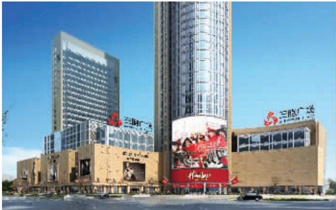
南京三胞广场设计效果图(以实际为准)

日前,三胞集团战略合作伙伴南京民营企业千百度国际控股有限公司(以下简称:千百度,01028.HK)将收购有255年历史的英国玩具店Hamleys的消息传出之后,很多家长和孩子关心,Hamleys何时能够进驻南京。记者获悉,有着“梦幻岛”之称的Hamleys不久将出现在三胞集团打造的新街口三胞广场,同时,去年被南京新百收购的另一个英伦百货品牌House of Fraser也将同期入驻。 通讯员 陈英