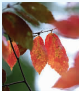
南京各景区的树叶开始退绿,或变黄,或“染红”