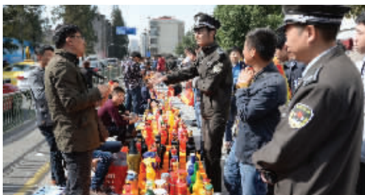
城管劝说商贩撤摊