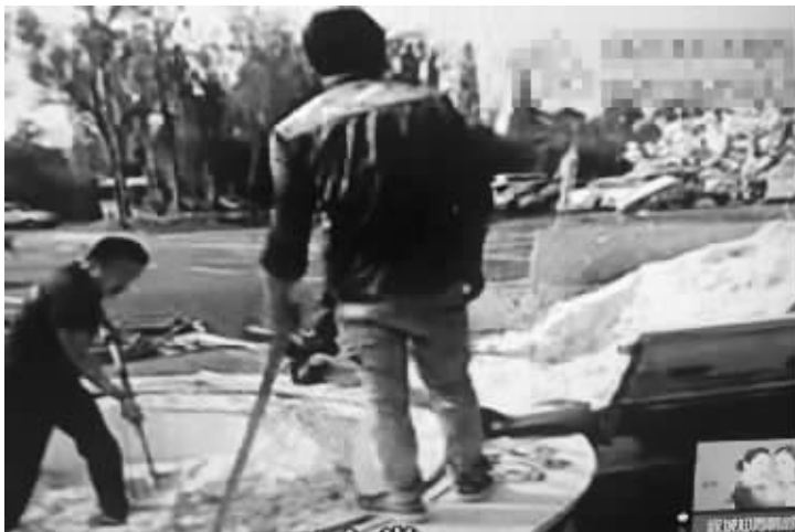
挑战结束后, 现场人员脚踩炒饭并将炒饭装进车